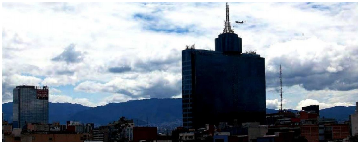
A diferencia de anteriores administraciones, Miguel Ángel Mancera no le apostará a las megaobras durante su sexenio.