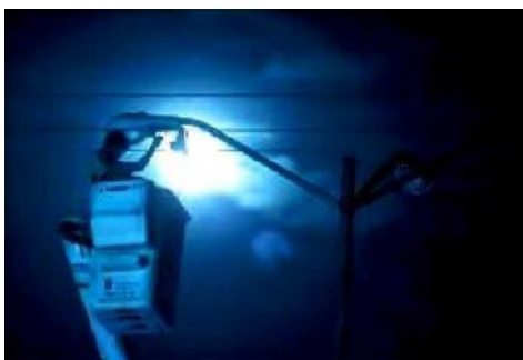
La administración capitalina le apuesta a obras para mejorar los sistemas de transporte masivo y la movilidad, por lo que también ajusta trabajos en vialidades primarias.