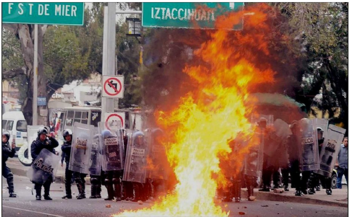
Durante su paso por la zona oriente de la ciudad de México, los encapuchados hicieron de las suyas, utilizando bombas molotov y petardos. Realizaron pintas y bloquearon los carriles centrales del Circuito Interior. (Foto: Luis A. Barrera).