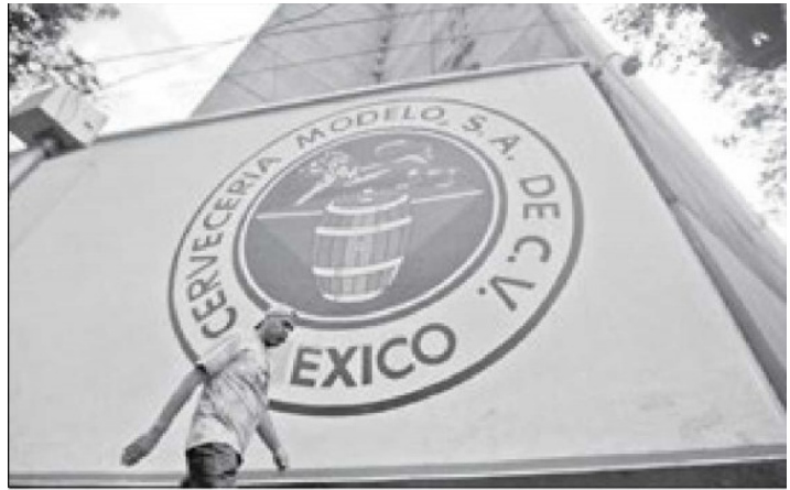
En el 2013 la IED se vio afectada por la venta atípica de acciones del Grupo Modelo a inversionistas extranjeros.