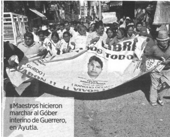
■ Maestros hicieron marchar al Góber interino de Guerrero, en Ayutla.