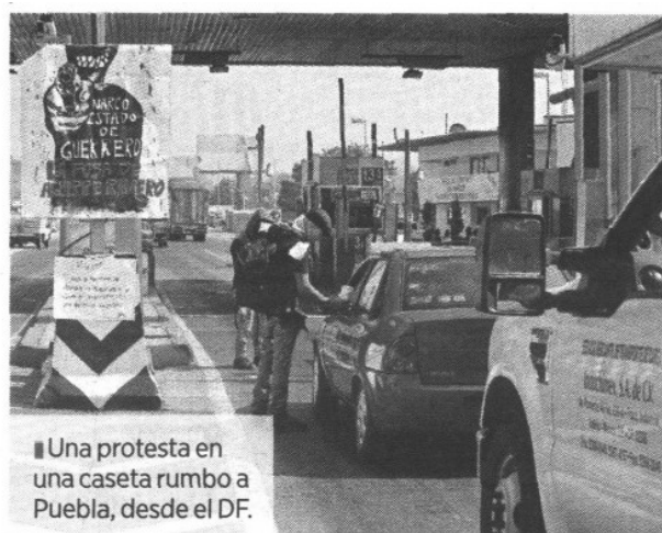
Una protesta en una caseta rumbo a Puebla, desde el DF.

Los maestros anunciaron que hoy sábado habrá una marcha en la ciudad de México en donde se prevé que haya más de cien personas exigiendo la renuncia de Peña Nieto por la inseguridad y la nula aplicación de justicia.