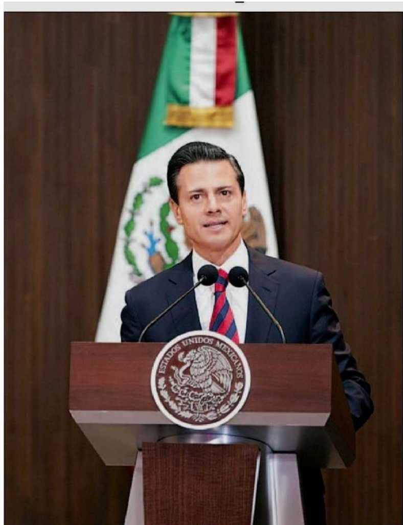
Reconoce al Congreso por el alcance internacional de reformas