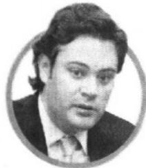
1. Aurelio Nuño

Jefe de la Oficina de la Presidencia Es el responsable de vigilar que todo el gabinete federal actúe conforme a las directrices de la Presidencia. Cercano al mandatario, el 22 de diciembre fue orador en el último acto de 2014 de Peña Nieto, un hecho inédito