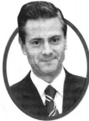
Enrique Peña Nieto Presidente de México

Su labor es dar puntual seguimiento a las órdenes y acuerdos que instruye el Presidente, diseña la agenda, giras y las actividades y eventos públicos. Es el secretario particular de Peña Nieto desde 2005 en el Edomex