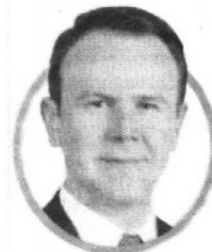
4. Francisco Guzmán Coordinador de Asesores del Presidente de la República

Ha sido el hombre encargado de revisar cada detalle de las iniciativas de reformas estructurales impulsadas por el Ejecutivo y de analizar controversias constitucionales en telecomunicaciones y la reforma educativa