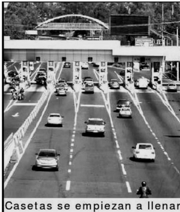
Casetas se empiezan a llenar