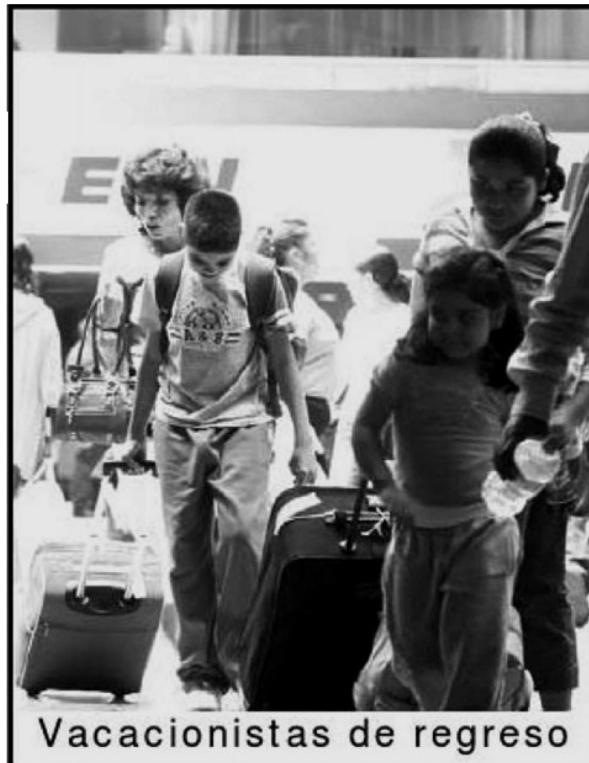
Vacacionistas de regreso