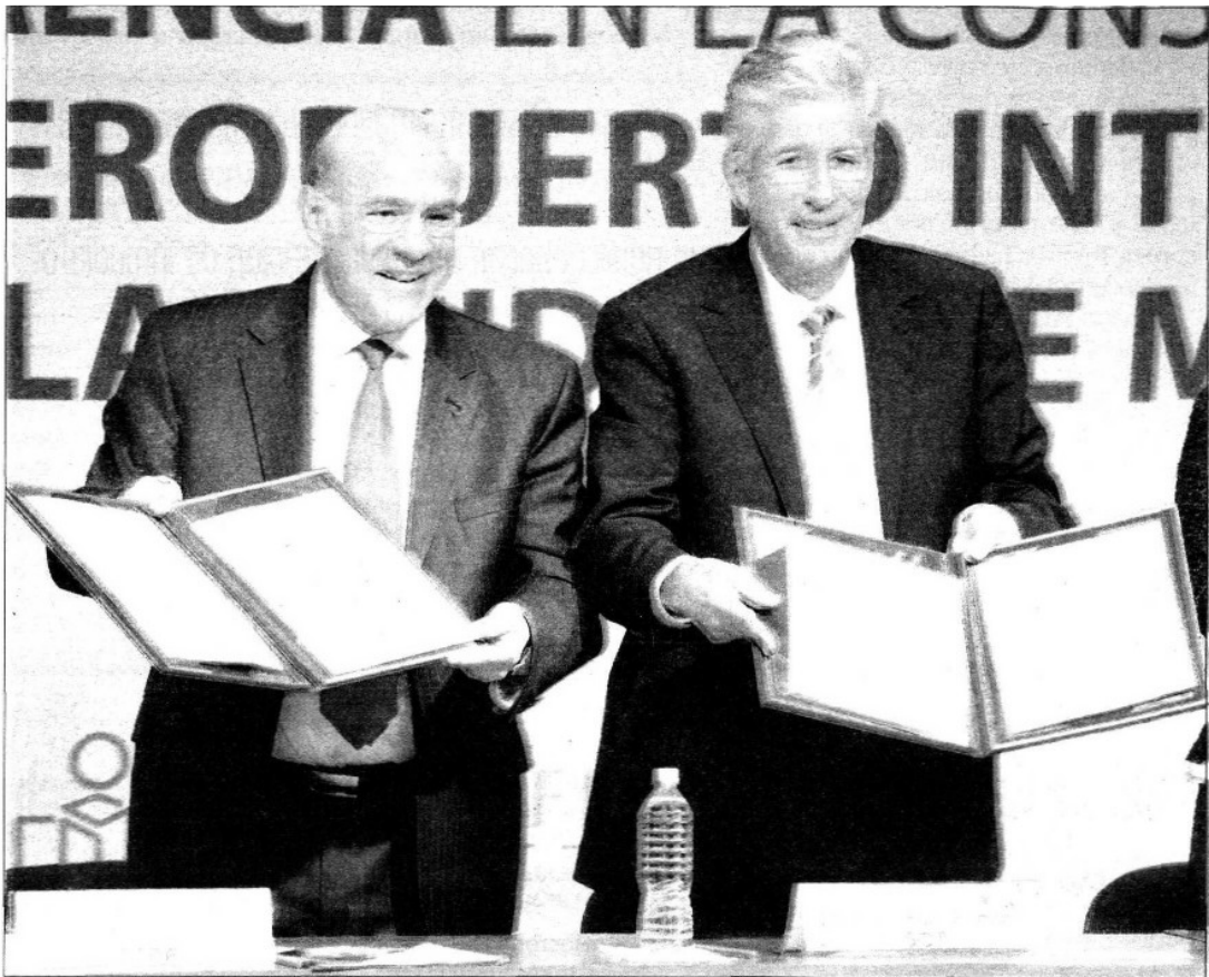
FIRMA. José Ángel Gurría, secretario general de la Organización para la Cooperación y el Desarrollo Económicos (OCDE), y Gerardo Ruiz Esparza, titular de la Secretaría de Comunicaciones y Transportes (SCT).