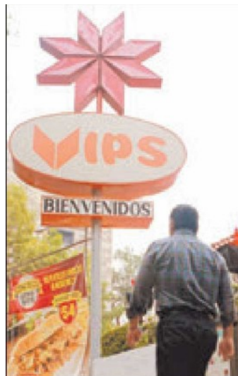
Alsea es una de las empresas que les gusta a los inversionistas para que potencialice sus acciones durante el presente año.

los títulos de la firma Rassini durante el año pasado.