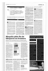
Se operarán montos importantes de instrumentos a tasa fija, dijo la SHCP.