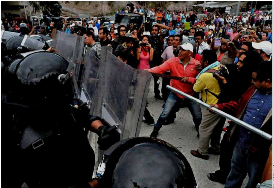
■ A las 18:00 horas los federales avanzaron por la autopista desplazando a los maestros con sus escudos y así liberar el tránsito en la autopista del Sol.