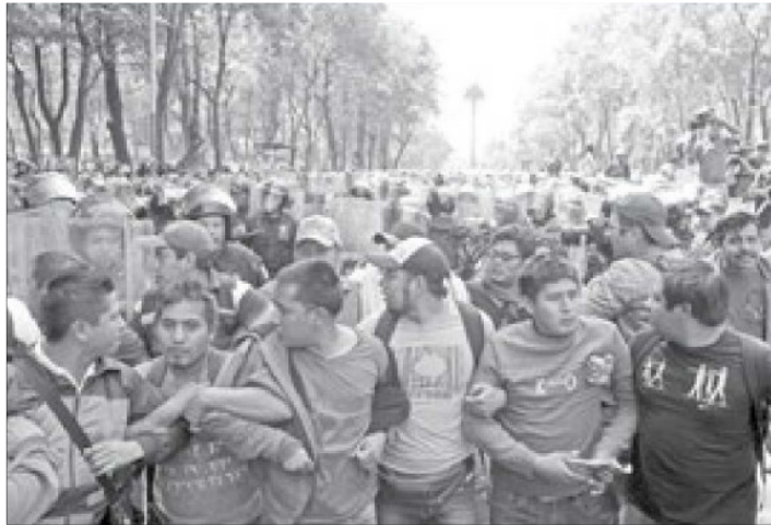
Los integrantes de la CETEG fueron replegados de Paseo de la Reforma por elementos de la SSPDF y la Policía Federal.