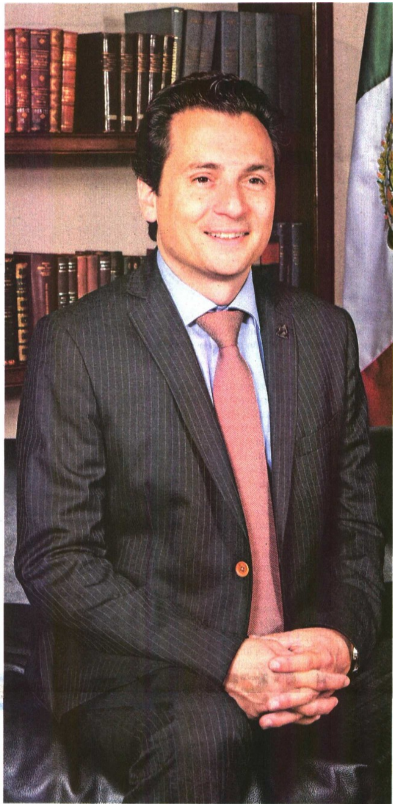
El director de Pemex asegura que prefieren ser más conservadores, y en vez de usar deuda, usar dinero del sector privado en coinversión