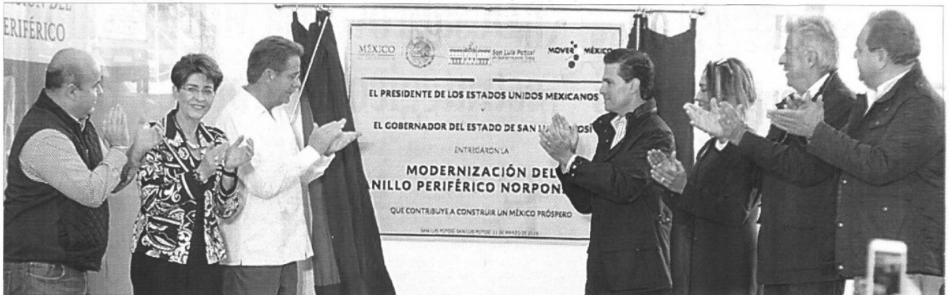
» ACOMPAÑADO POR la secretaria de Salud, Mercedes Juan; el gobernador de San Luis Potosí, Fernando Toranzo y el titular de la SCT, Gerardo Ruiz Esparza, entre otros, el presidente Enrique Peña Nieto entregó las obras de modernización del Anillo Periférico de la capital potosina.