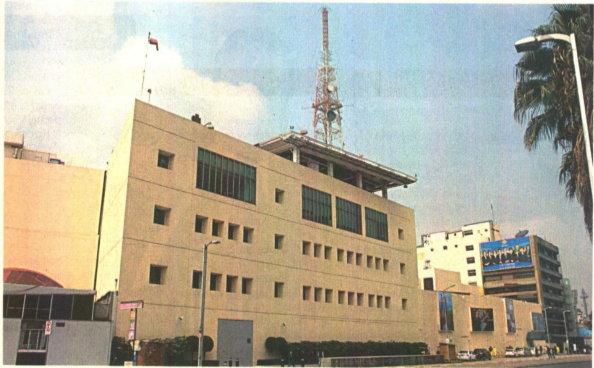
El pasado martes, el IFT determinó en un dictamen preliminar que el agente dominante integrado por Grupo Televisa, Empresas Cablevisión, Televisión Internacional, Cable TV e Innová tiene poder sustancial en 2 mil 124 zonas del país.