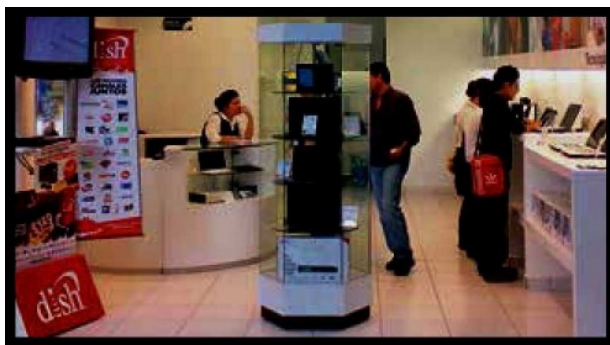
TELMEX YA NO CONDICIONARÁ EL SERVICIO de telefonía al pago de adeudos extras.