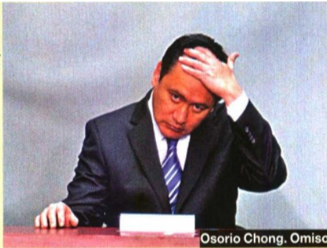
Osorio Chong. Omisó