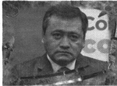
MIGUEL ÁNGEL OSORIO CHONG.