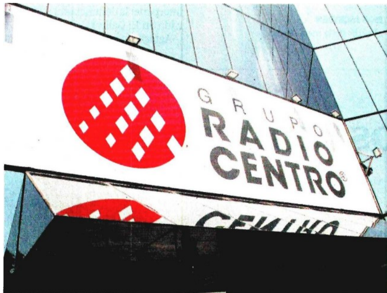
Grupo Radio Centro no pudo cumplir con el pago de más de tres mil millones de pesos que había ofrecido en licitación por la concesión de una cadena de TV.