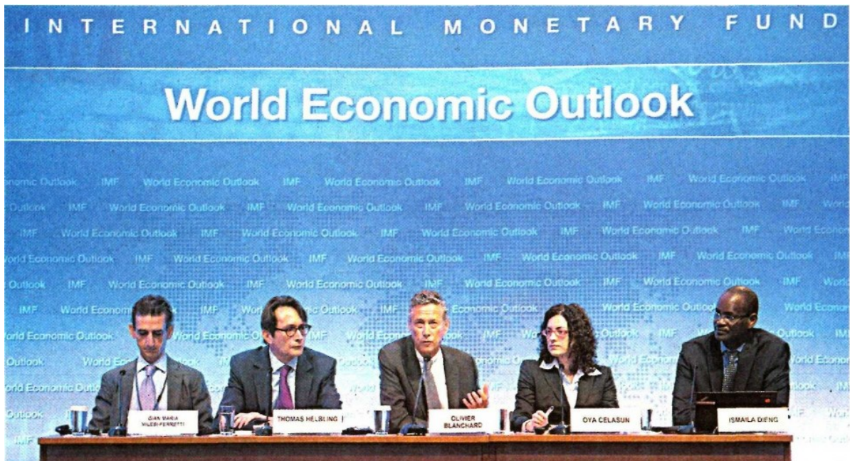
El economista jefe del FMI, Olivier Blanchard (centro), destacó que el crecimiento económico de este año será más fuerte para las economías avanzadas que para los países emergentes.