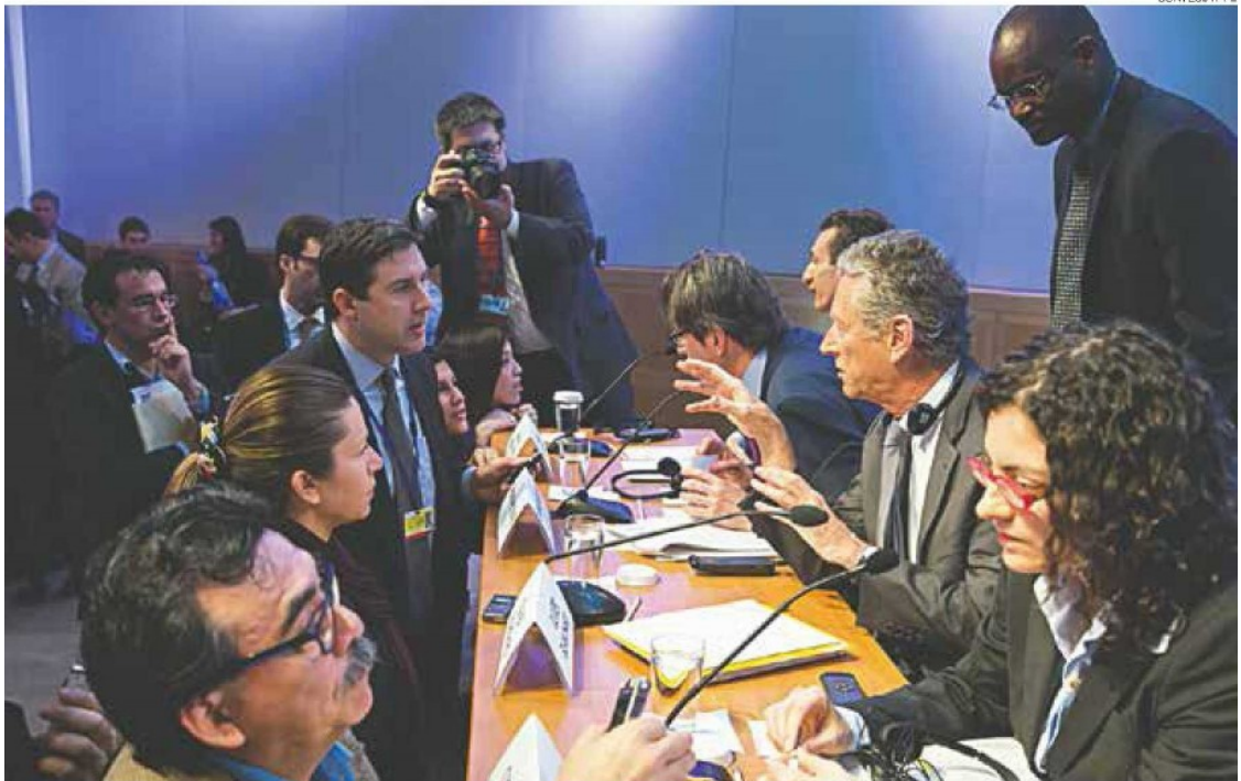
CONFERENCIA. Al centro de los panelistas del FMI, Olivier Blanchard, en la presentación de las perspectivas económicas.