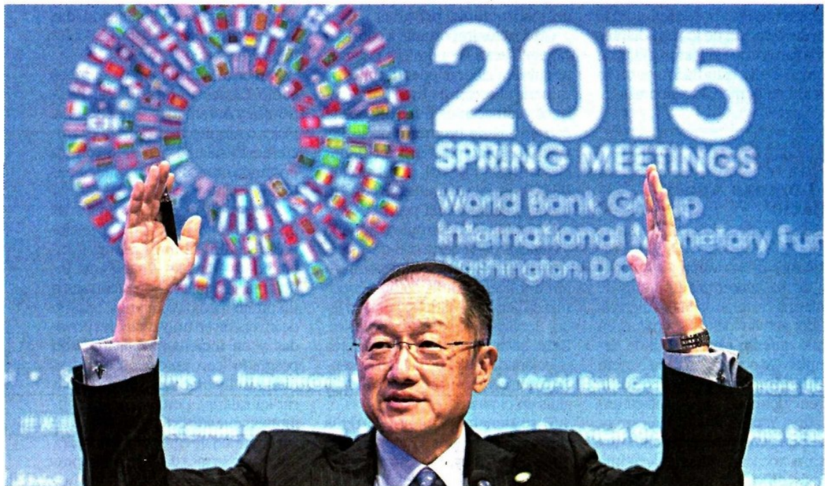
SHAWN THIEW/ EFE

*Cifras estimadas para 2015 y 2016. Fuente: FMI