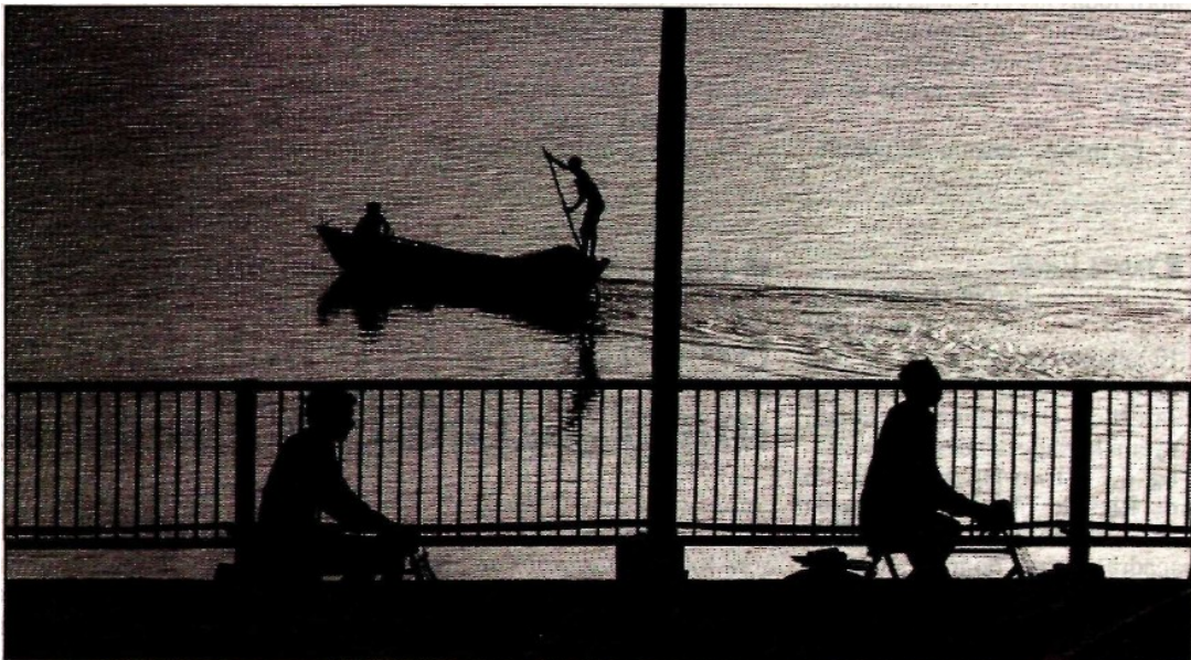
Ciclistas pasan por un puente que cruza el río Ganges, mientras unos pescadores navegan en bote