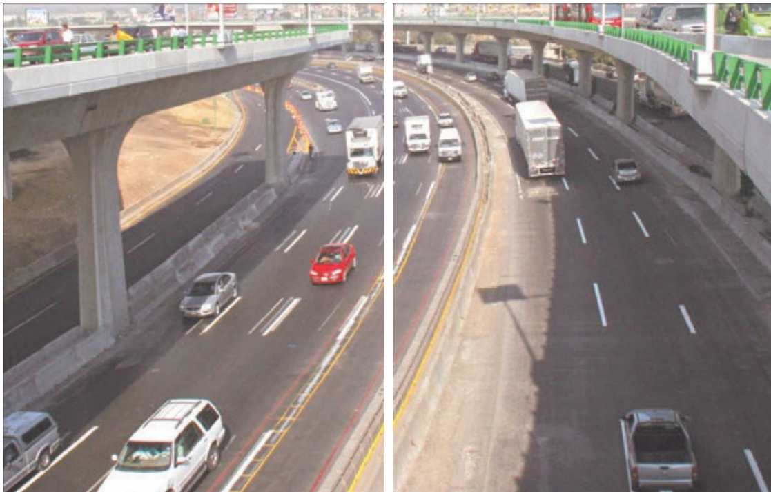
La filial en México de DHL es una de las principales concesionarias de autopistas en México, como el Viaducto Bicentenario en el Estado de México.