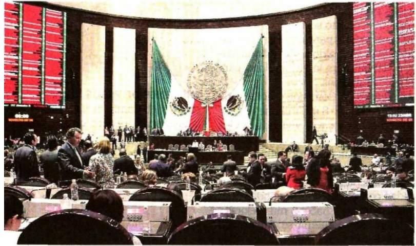
Los recursos que se ahorraron en el Poder Legislativo fueron de 26 millones 518 mil pesos, de los cuales, 9.1 millones provinieron de la Cámara de Diputados.