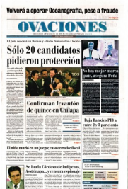
Luis Videgaray y Enrique Peña.