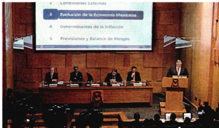
El martes el gobernador del Banco de México, Agustín Carstens, hizo el anuncio del recorte de la proyección del PIB.