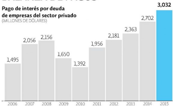
Pago de interés por deuda de empresas del sector privado (MILLONES DE DÓLARES)