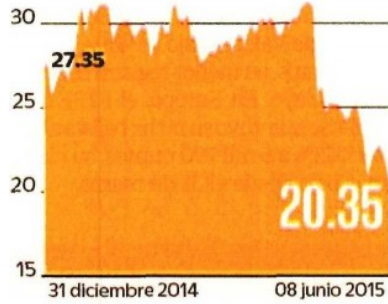
OHL México (Pesos por acción)