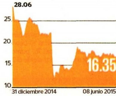
Genomma Lab (Pesos por acción)