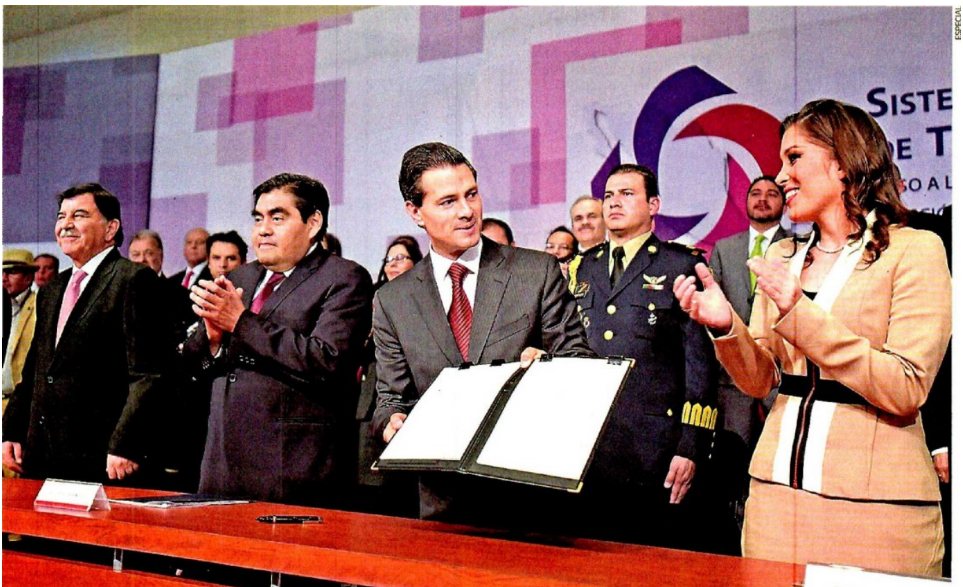
El presidente Enrique Peña Nieto encabezó la ceremonia de instalación del Consejo del Sistema Nacional de Transparencia, Acceso a la Información y Protección de Datos Personales. Asistieron gobernadores, secretarios de Estado, líderes partidistas y sindicales, académicos e integrantes de los órganos garantes.