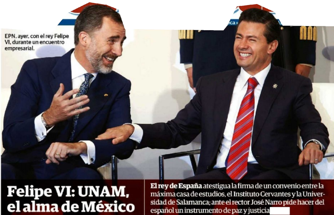
EPN, ayer, con el rey Felipe VI, durante un encuentro empresarial.