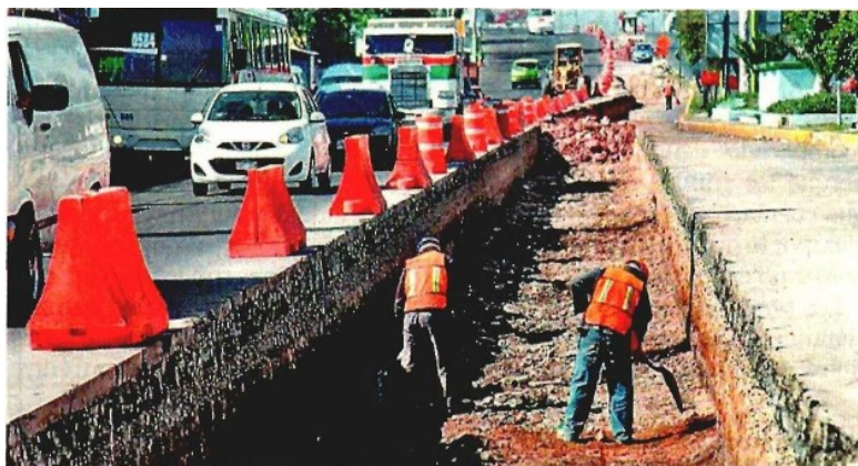
El segundo piso mexiquense, con 22 kilómetros de autopista, opera desde 2010, pero aún no hay fecha para el inicio de obra de lo que sería el Mexibús.

A la fecha, esta autopista elevada de cuota permanece inconclusa, pues aunque ya existe y opera un cuerpo de 22 kilómetros, aún están pendientes 18 kilómetros del segundo cuerpo de carriles de retorno hacia el DF. ●