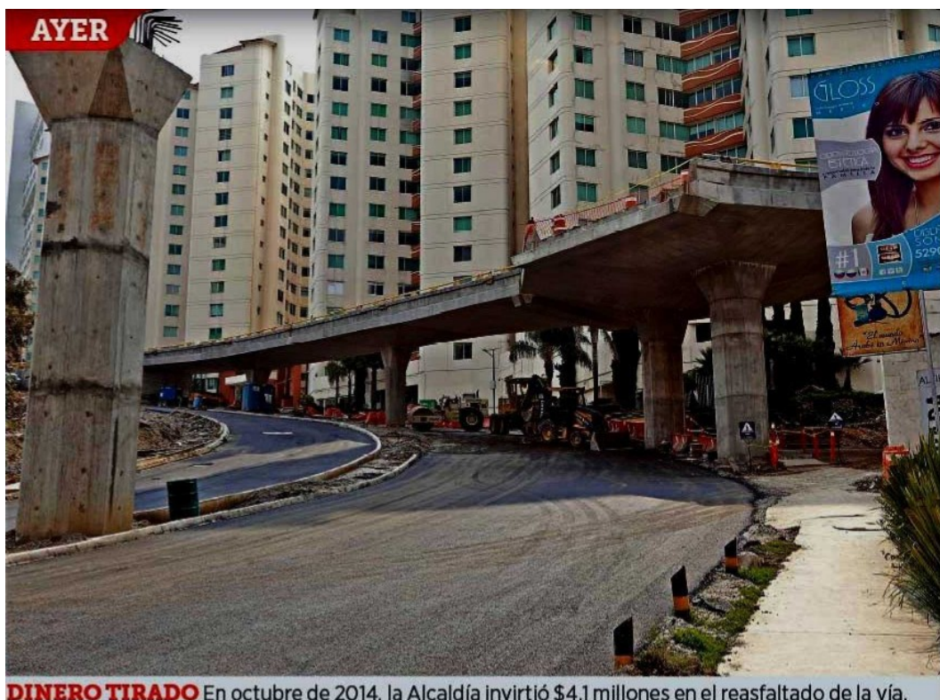
DINERO TIRADO En octubre de 2014, la Alcaldía invirtió $4.1 millones en el reasfaltado de la vía.