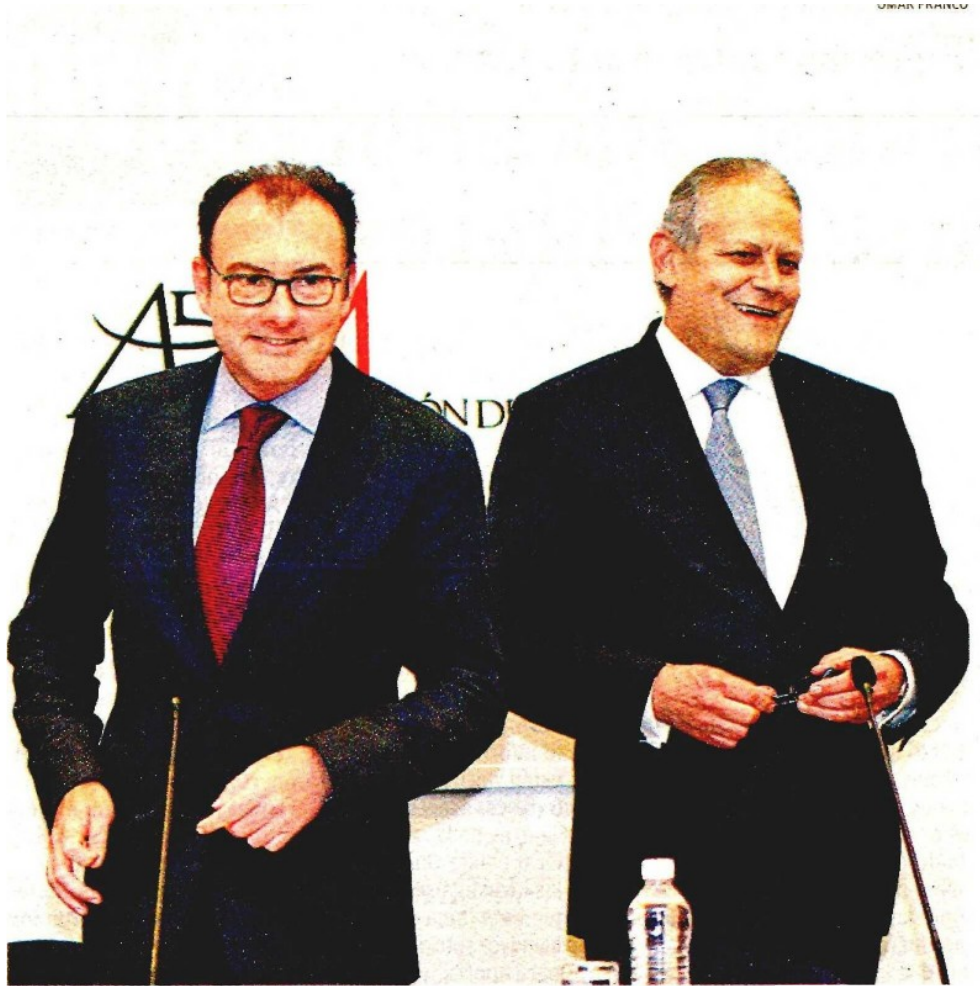
Firman acuerdo para reducir el precio de los créditos hipotecarios.