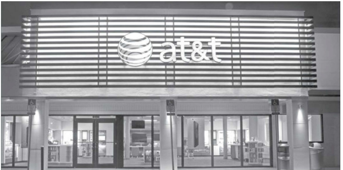
La compra que hizo AT&T de Iusacell-Unefón y Nextel impulsó el registro de IED del primer semestre del año.