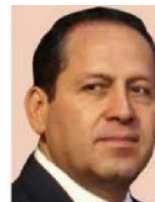
Eruviel Ávila Villegas Cargo: Gobernador del Estado de México