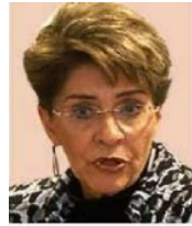
Mercedes Juan López Cargo: Secretaria de Salud