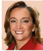
Claudia Ruiz Massieu Cargo: Secretaria de Turismo