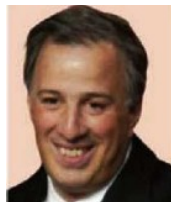
José Antonio Meade Cargo: Secretario de Relaciones Exteriores