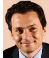
Emilio Lozoya Austin Cargo: Director de Pemex