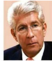
Gerardo Ruiz Esparza Cargo: Secretario de Comunicaciones y Transportes