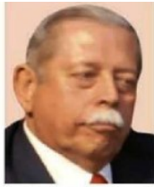
Egidio Torre Cantú Cargo: Gobernador de Tamaulipas