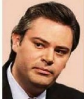
Aurelio Nuño Cargo: Jefe de la Oficina de Presidencia

A la toma de protesta de la nueva dirigencia, asistieron funcionarios, líderes, gobernadores y legisladores: