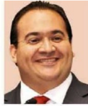
Javier Duarte de Ochoa Cargo: Gobernador de Veracruz