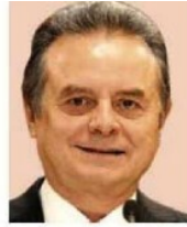
Pedro Joaquín Coldwell Cargo: Secretario de Energía