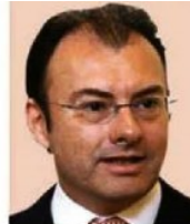
Luis Videgaray Cargo: Secretario de Hacienda y Crédito Público