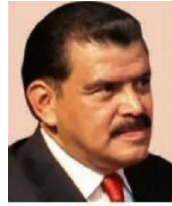
Francisco Olvera Cargo: Gobernador de Hidalgo