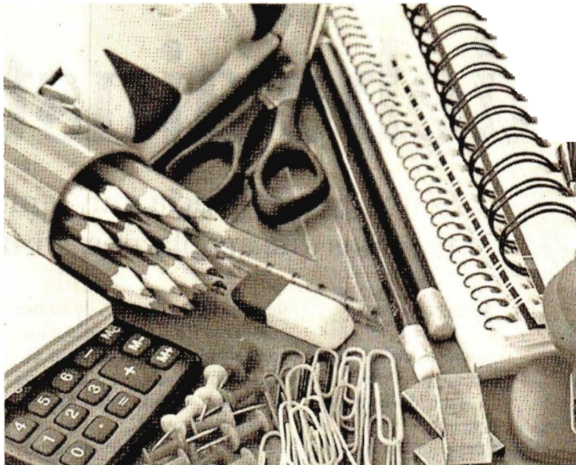
EL INCREMENTO quincenal que reportaron los precios fue resultado del aumento en precios y servicios vinculados al regreso a clases.

El índice de precios de la canasta básica registró una alza de 0.24 por ciento, así como una tasa anual de 2.05 por ciento. En la misma quincena de 2014 los datos correspondientes fueron de 0.21 y 4.99 por ciento.