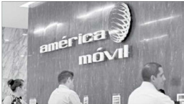
Telmex informó que analiza el alcance legal de los procedimientos que en su contra inició ayer el IFT, en su liga comercial con DISH y legalidad de UnoTV.