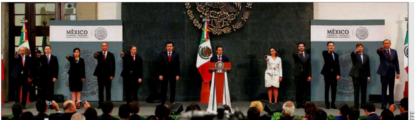
NOMBRAMIENTOS. Los nuevos titulares rinden protesta en una ceremonia en Los Pinos.

Osorio Chong fue instruido por el presidente Peña Nieto para hacer la presentación formal de cada uno de los funcionarios “ante los servidores públicos que integran las áreas de responsabilidad que les han sido conferidas”.