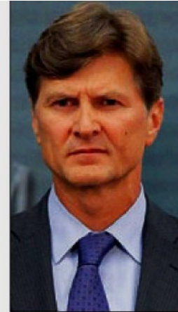
Enrique de la Madrid.