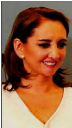
Claudia Ruiz Massieu.