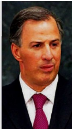
José Antonio Meade.