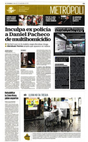
Se prevé que el actual Aeropuerto Internacional de la Ciudad de México va a quedar libre en 2020, cuando esté lista la nueva sede.