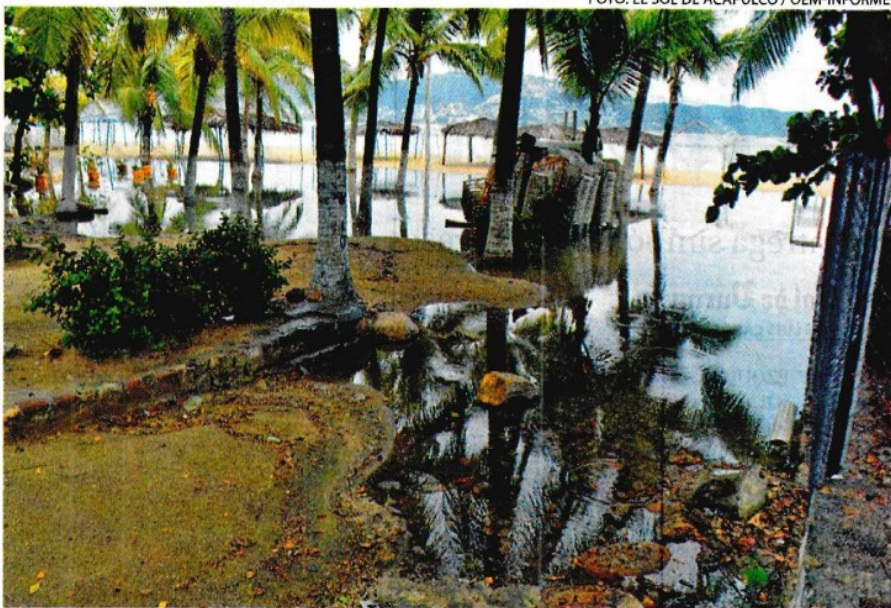
LAS GRANDES olas ocasionadas por el efecto del “Mar de fondo” dejaron daños considerables.

por el efecto del “Mar de fondo” dañaron la plancha y pasamanos del Paseo del Pescador en la bahía de Zihuatanejo, y las marejadas socavaron un pedazo del acceso principal de un restaurante en playa La Madera; además continuó el arrastre de basura en playa La Principal y el puerto a la navegación permaneció cerrado.