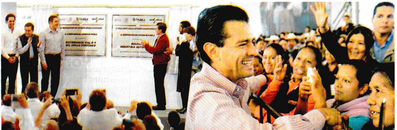
EN EL marco de la entrega del boulevard Industria Automotriz y del distribuidor vial D9 en San José Chiapa, Puebla; Enrique Peña Nieto afirmó que junto a ella, se han hecho importantes anuncios de nuevas inversiones que habrán de concretarse en los próximos años, del orden de 25 mil millones de dólares.