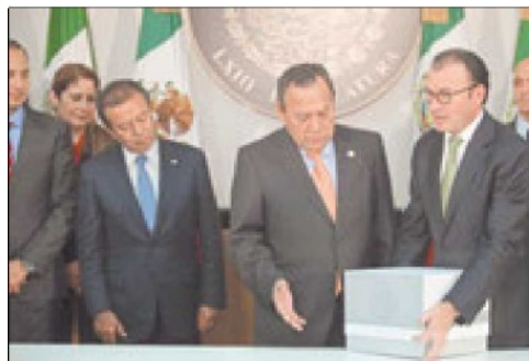
Luis Videgaray , secretario de Hacienda, en la entrega del paquete económico 2016.