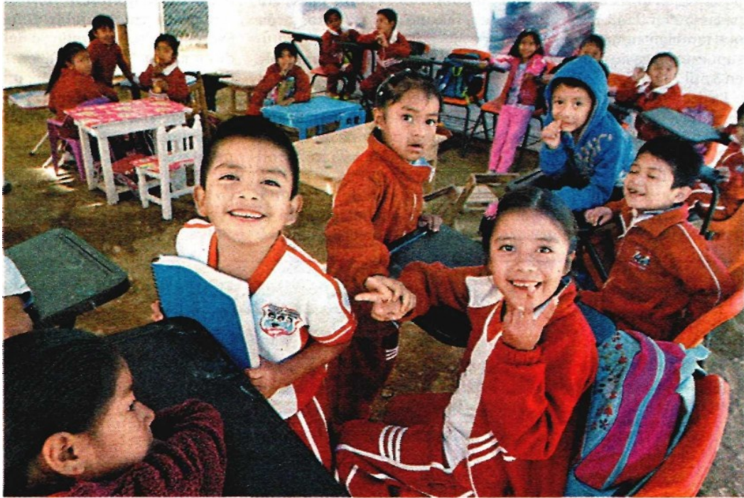
Trabajadores del sector educativo vieron disminuidos sus ingresos.