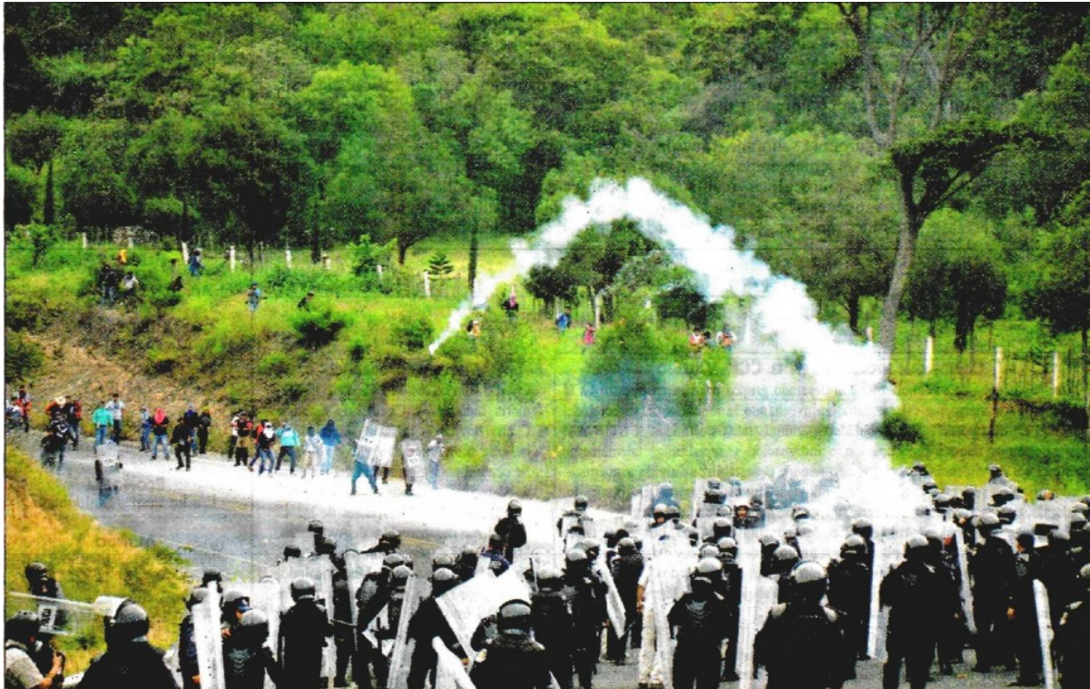
Policías de Guerrero lanzan gases lacrimógenos contra estudiantes normalistas, quienes responden con piedras y cohetones en la carretera federal Chilpancingo-Tixtla, en la zona conocida como Los Túneles. El zafarrancho se originó cuando los uniformados exigieron revisar un convoy de 11 autobuses y varios vehículos particulares que transportaban a familiares de los 43 estudiantes desaparecidos y alumnos normalistas, la mayoría de Ayotzinapa, hacia la ciudad de México, lo cual fue rechazado. En el lugar fue incendiado un camión de carga ■ Foto Ap

■ Impidieron agentes el paso de convoy de padres de los 43 hacia el DF ■ Doce de los heridos son alumnos; acusan del operativo al gobernador