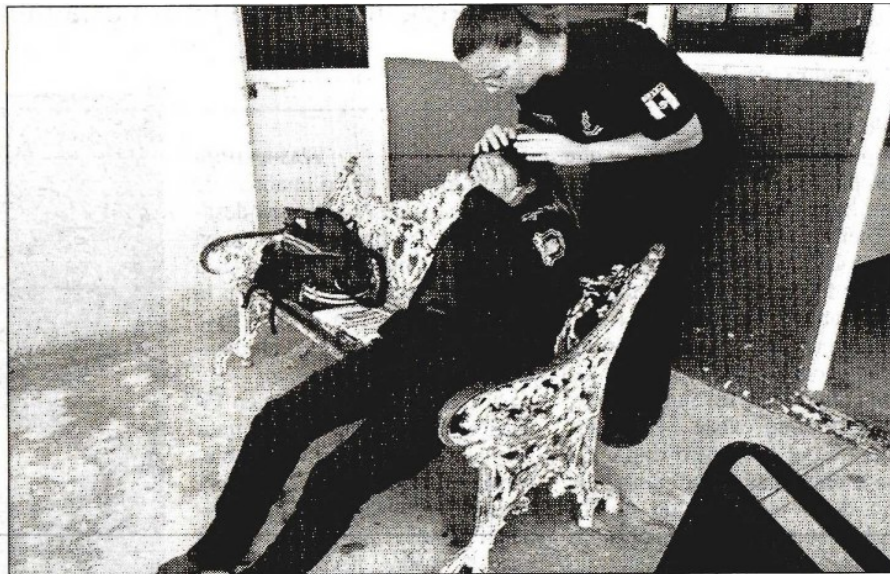
Imagen del vehículo incendiado en la zona conocida como Los Túneles. En la siguiente fotografía una mujer policía recibe atención médica