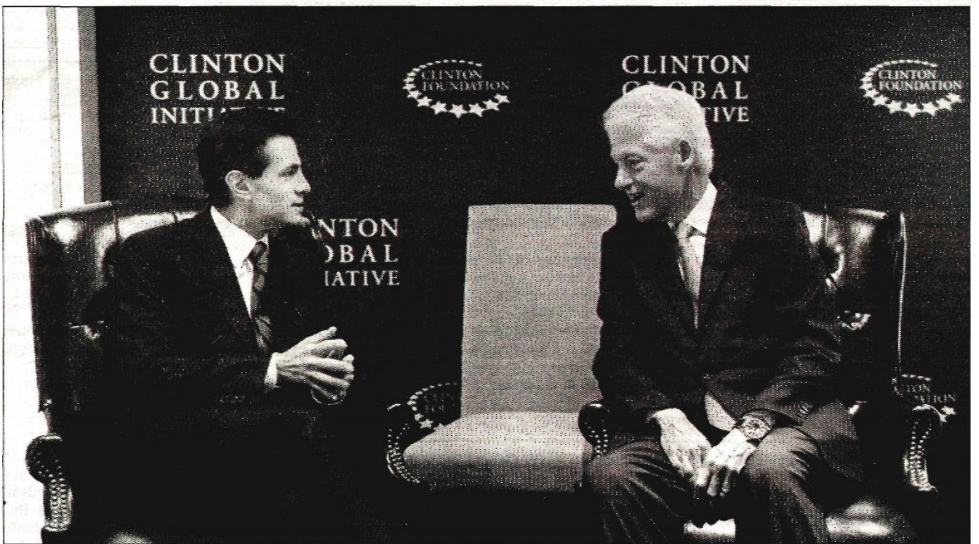
El presidente Enrique Peña Nieto sostuvo ayer un encuentro en Nueva York con el ex mandatario de Estados Unidos Bill Clinton