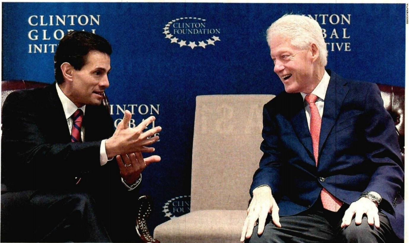
Como parte de sus actividades en la ONU, el presidente Enrique Peña Nieto se reunió ayer con el ex presidente de Estados Unidos Bill Clinton, con quien conversó sobre la agenda global en materia de medio ambiente.