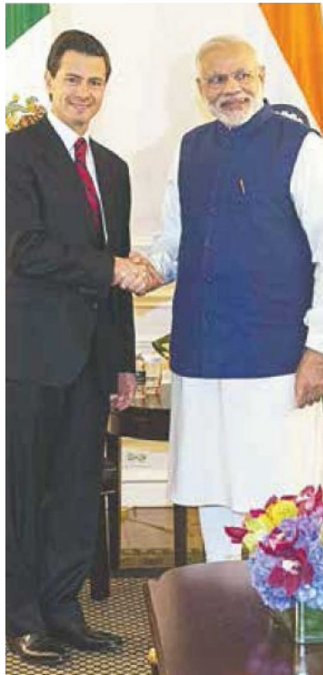
REUNIÓN. Con Narendra Modi, primer ministro de la República de la India.