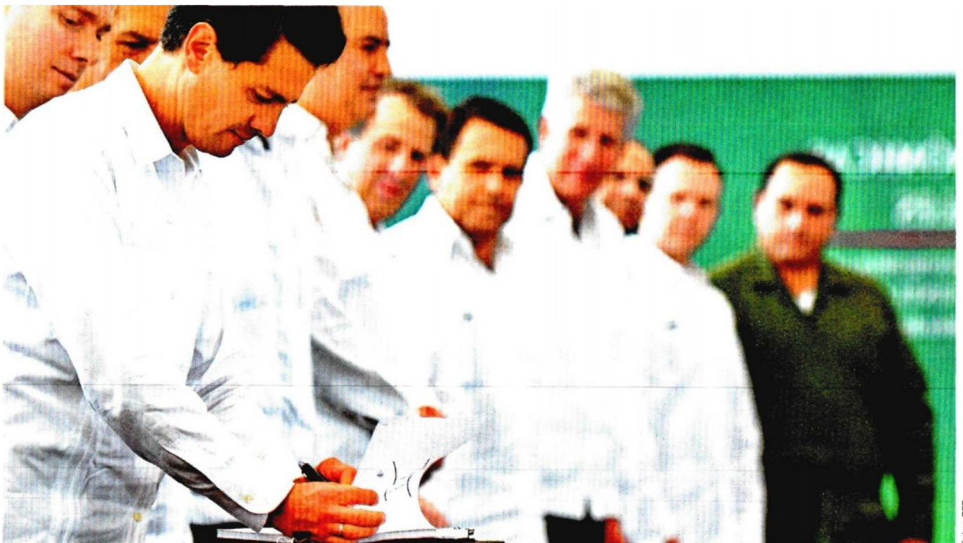
El presidente, Enrique Peña Nieto, encabezó la presentación de las tres Zonas Económicas Especiales en las que se incluyen el istmo de Tehuantepec, Puerto Chiapas y municipios colindantes a Puerto Lázaro Cárdenas.

Fuente: Medición de Pobreza 2014 del Coneval, Información sobre Delegaciones y Representaciones de la Secretaría de Economía.