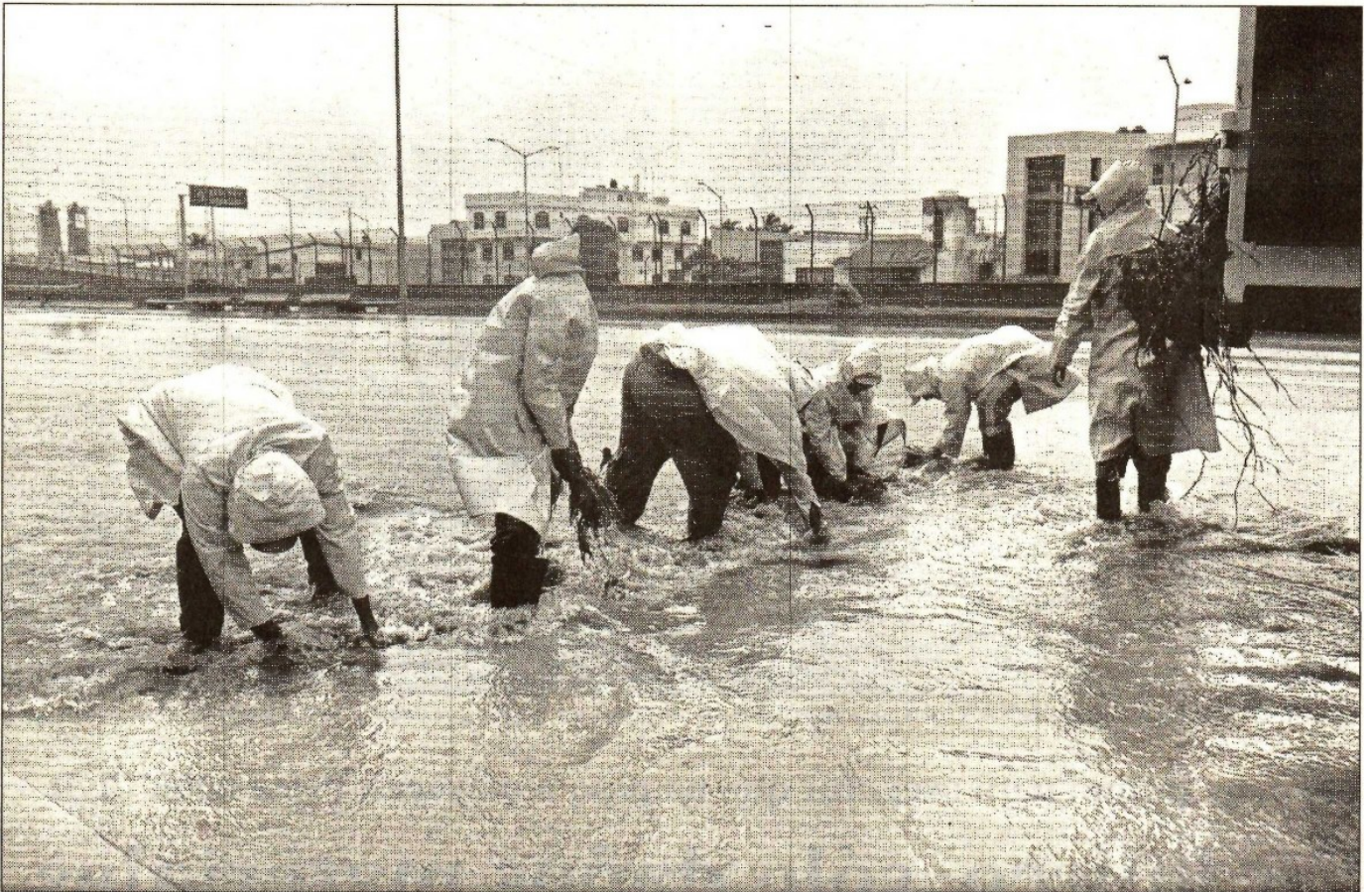
Empleados municipales desazolvan una avenida de Manzanillo, Colima, tras una de las fuertes lluvias que ha causado el huracán en este puerto

En las primeras horas de ayer el presidente Enrique Peña Nieto encabezó una reunión de emergencia con los integrantes de su gabinete para definir medidas de prevención frente a la inminente entrada en territorio nacional de Patricia